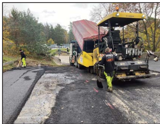
Ett fotografi på en asfaltmaskin på "räddningsgatan" bakom högghuset får illustrera begreppet "underhållskostnad".

också kostnaden för "vatten och avlopp" - det senare är i huvudsak det vatten som vi i föreningen använder under ett år.