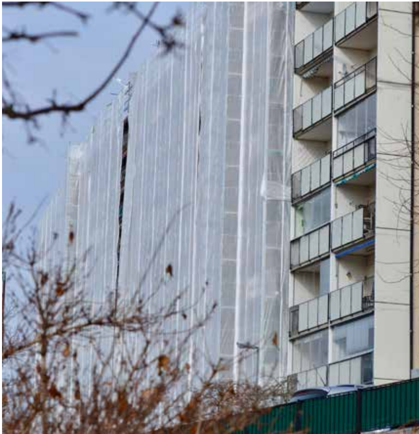
Draperingen på höghuset är för allas säkerhet och flyttas sektionvis efter vart att arbetet är klart.

utbildade sanerare som är experter på det de gör och medvetna om att PCB har en mer än hundraårig nedbrytningsprocess om det till exempel tappas ner i marken.