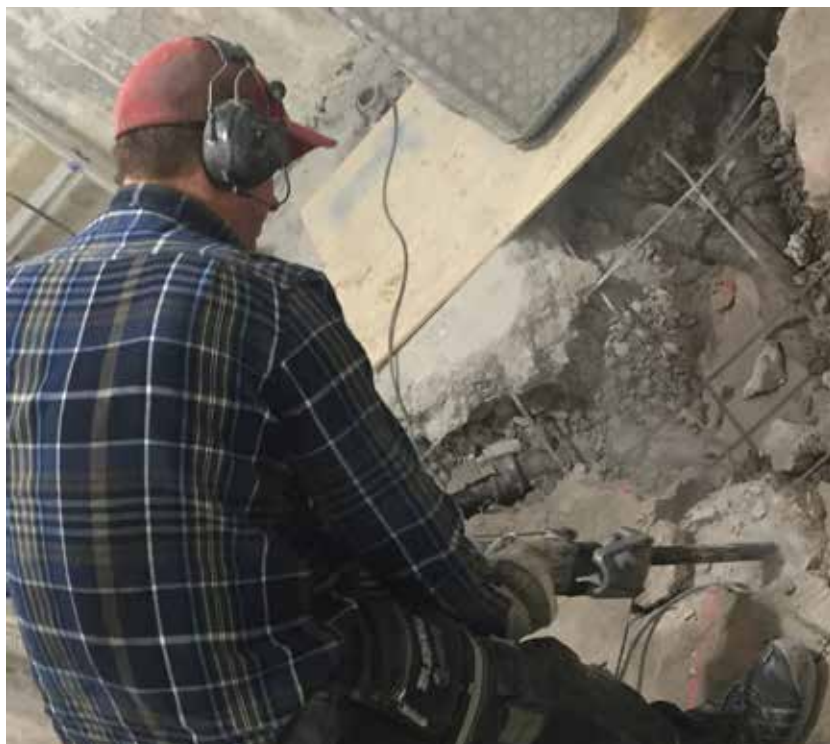
Gamla rör bilas bort för att förhindra läckage.