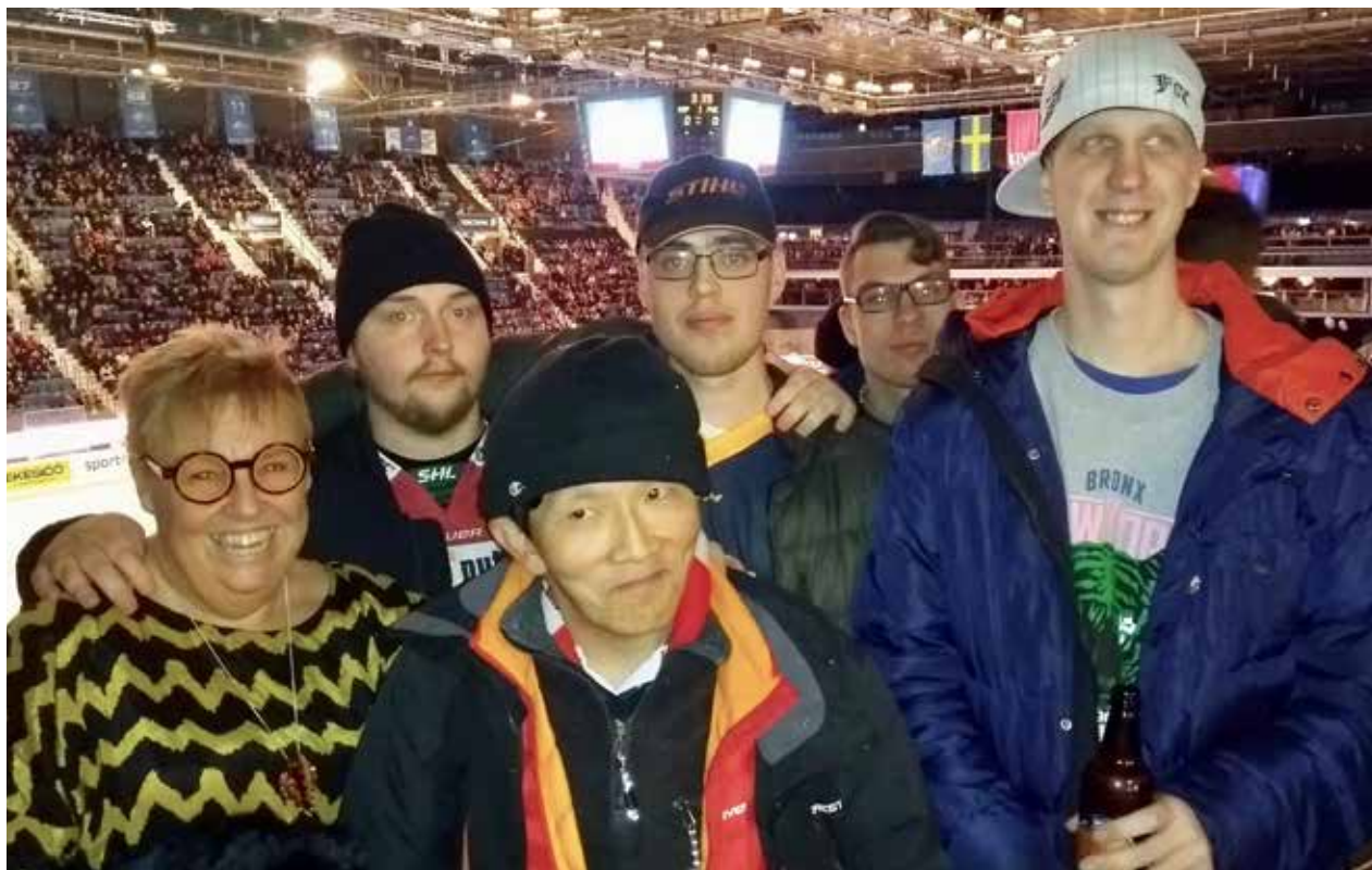
Cameleonterna, föreningens extraarbetare, de som ser till att det är rensat och fixat och att vi får våra meddelanden i brevlådan

en Djurgårdsmatch om det inte är Djurgården som AIK möter och vice versa, så tre Cameleonter vägrade följa med och då blev det så att hela gänget fick åka två gånger och alla följde med. En AIK och en Djurgårdsmatch. Så nu är det klart att Cameleonterna varit på hockey, inte bara en gång utan två gånger tack vare Solhjulet och tack vara allt jobb de uträttat för föreningen.